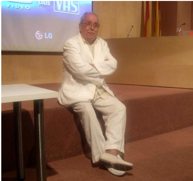
Giménez-Rico va defensar el cinema espanyol

El director de cine Antonio Giménez-Rico , ex president de l'Acadèmia de les Arts i les Ciències Cinematogràfiques, expressà el seu absolut rebuig al doblatge al castellà de las pel·lícules estrangeres, i considera que tal pràctica, implantada per una llei franquista de 1940 per a la defensa del cinema espanyol i de la pròpia llengua, s'ha convertit al final en un handicap i ha estat el pitjor enemic del cine espanyol. De totes maneres, a dia d'avui veu molt difícil eliminar-lo, com a mínim a curt termini.