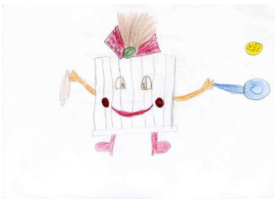
4t PREMI: Isabel Cappuins (7 anys)