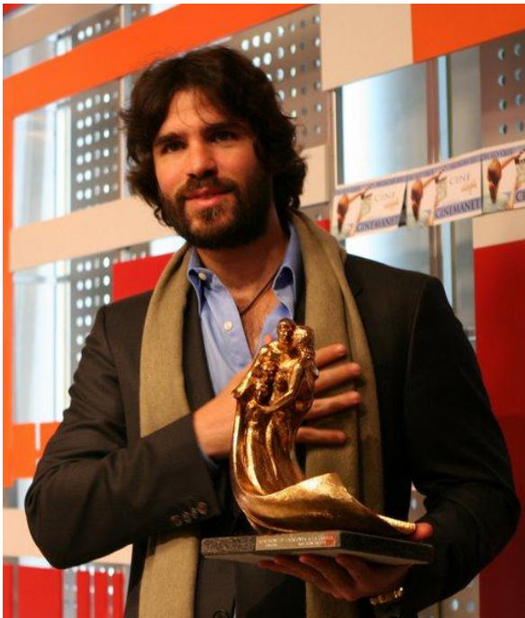
Eduardo Verástegui mostra el guardó.

L'actor mexicà va agrair el premi i va dir: “El rebo amb molta humilitat en nom de totes les persones que es van involucrar per a portar a terme Bella , i principalment les que ens van obrir la porta de la seva distribuïdora, que també estan aquí. Els dono les gràcies per haver cregut en el missatge de Bella , missatge de vida, d'amor, d'esperança i de fe”.