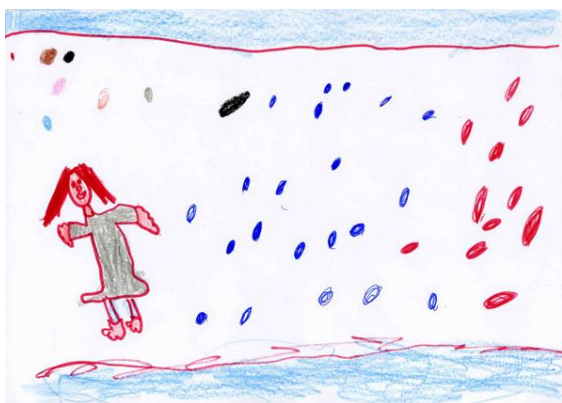
3r PREMI: Teresa Cappuins (4 anys)