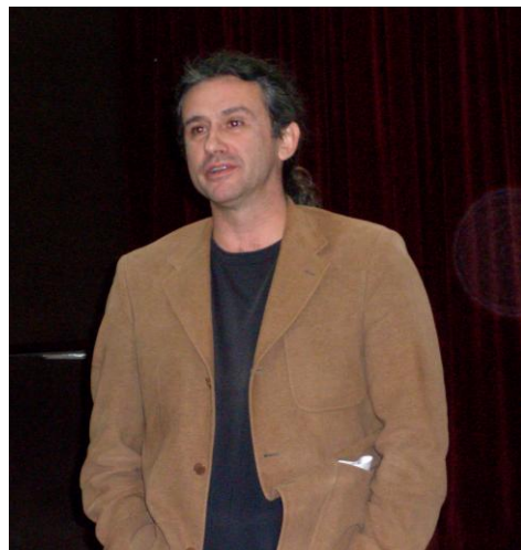
Javier Balaguer fou pioner en tractar la violència domèstica al cinema

El dia 14 de novembre de 2008 es realitzava la projecció de la pel·lícula “Sólo mía”, de Javier Balaguer , essent el mateix director qui va dirigir el col·loqui. És una de les pel·lícules més rellevants en aquest camp i la primera que va tractar directament del tema a Espanya. Arasa afirmava que serien sessions de denúncia, encara que, va precisar, “no volem limitar-nos a exposar el mal. Volem arribar al fons, als motius pels quals es produeix el maltractament i aportar alguna idea que contribueixi almenys a reduir el mal. En algunes de les sessions participaran experts, com psicòlegs, psiquiatres i pedagogs, que exposaran la seva interpretació. Volem que aquest problema es tracti amb visió integral de la persona humana i de la seva dignitat”.