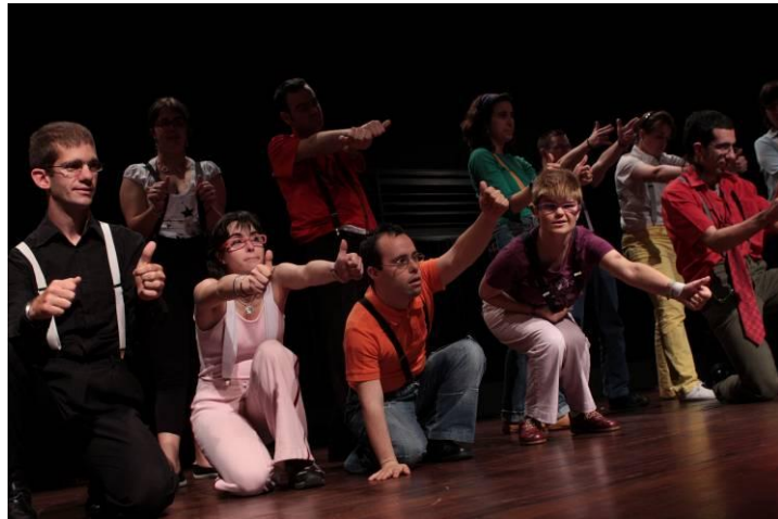
Els nois de Ludàlia durant la seva interpretació teatral.