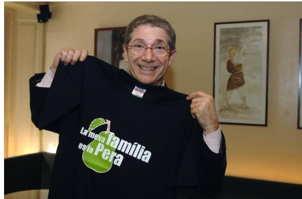
La meua família és la Pera

L'actor manifestà: "Sempre he procurat inculcar valors humans i servir a través d'ells. Es diu que per això sóc un dels actors que més comunica. Desitjo promoure el somriure a la vida de les persones, com una petita aportació a l'oblit de problemes, penes, malalties".