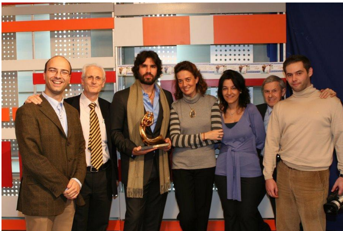
Eduardo Verástegui amb membres de l'equip de CinemaNet a Madrid

Va haver de decidir-se precipitadament. Els distribuïdors de la pel·lícula “Bella” van informar que Eduardo Verástegui faria un viatge de molt poques hores a Madrid amb la finalitat de mantenir reunions amb empresaris sobre futurs projectes Cinematogràfics. Era l'ocasió per a poder lliurar-li la “Ola de Oro” del Premi Cinematogràfic “Família” a la pel·lícula “Bella”. Això modificava radicalment els plans de CinemaNet, que preveia realitzar un acte de gran dimensió a la monumental sala d'actes de la Universitat Abat Oliba, en col·laboració amb aquesta universitat. Com sembla que Verástegui no podrà tornar a Espanya fins d'aquí molts mesos perquè està a punt d'iniciar el rodatge d'una pel·lícula a Nova Zelanda, es va decidir donar el premi en un acte improvisat, a Madrid, el mateix dia 29 de desembre, data de la visita de l'actor. Se celebraria finalment en un plató del Grup Intereconomía, a la seu del qual se celebrava la reunió dels citats empresaris amb els promotors del nou film.