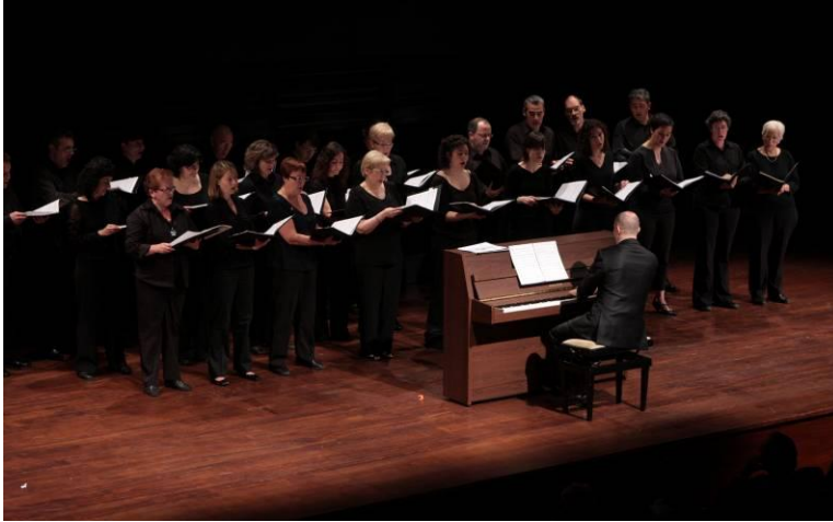
L' Orfeó Atlàntida interpretà cançons de cine

Ludàlia, entitat dedicada a la formació dels joves discapacitats intel·lectuals a través del temps de lleure, presentà els joves que han guanyat aquests dies el Primer Premi "Joves amb valors" de la Fundació La Caixa i interpretaren els sketches "Amor y locura", demostrant una gran millora en la seva formació artística respecte a edicions anteriors.